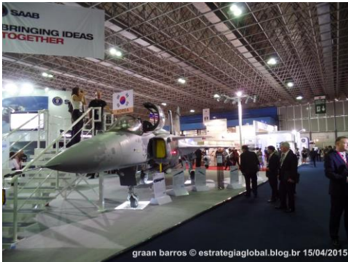
graan barros © estrategiaglobal.blog.br 15/04/2015