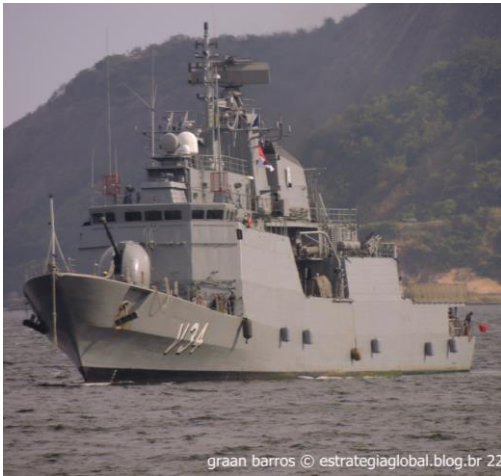
graan barros 22