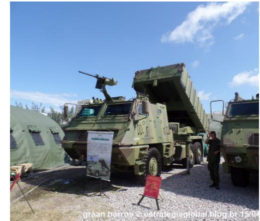
graan barros © estrategiaglobal.blog.br 15/04